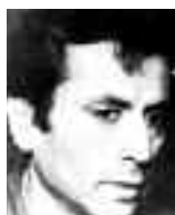
MARIO ROBERTO SANTUCHO

“Contra el saqueo, la única lucha es la de los trabajadores”. ★