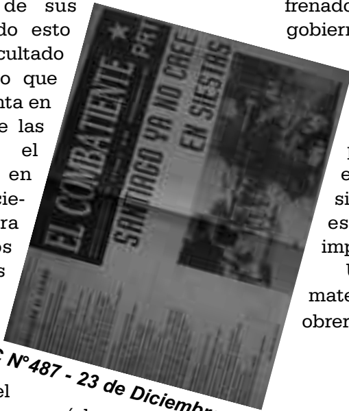
EC N°487 - 23 de Diciembre 1993

Unifiquemos nuestros reclamos, materializando la unidad de la clase obrera y el pueblo. ★