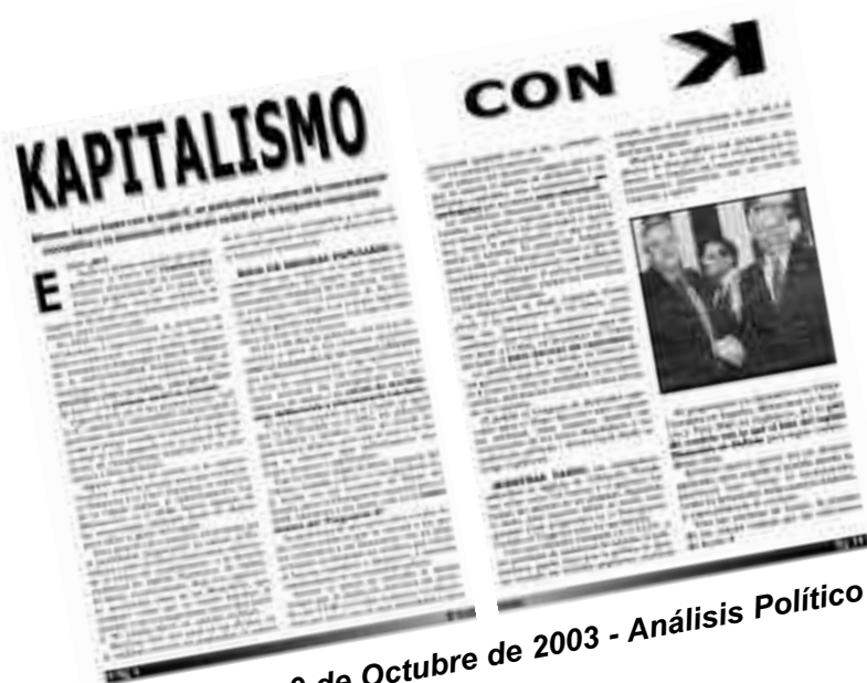
EC N°722 - 9 de Octubre de 2003 - Análisis Político

Nada está escrito, todo está por escribirse cuando de luchar estamos hablando.★