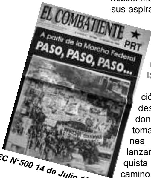
EC N° 500 14 de Julio 1994

ción, la organización desde abajo, en donde las mayorías tomamos las decisiones por las cuales lanzarnos a la conquista y elegimos el camino para lograrlo, son la expresión de