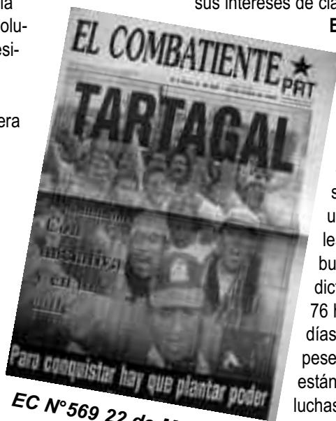
EC N°569 22 de Mayo 1997

El desafío de nuestro periódico es proyectar los acontecimientos claves de la lucha de masas no sólo en el momento en que se producen sino cuando trascienden esa actualidad; y ahondar en los ejes que permitan profundizar en la acción política por el poder, sembrando una semilla que va dando sus frutos en la lucha de clases. Allí ponemos todo nuestro esfuerzo, fortaleciendo y renovando el compromiso con los objetivos estratégicos de la clase obrera y el pueblo. Es de vital importancia para ello que la clase obrera y los destacamentos de vanguardia cuenten con una herramienta cada vez más fuerte que exprese sus intereses de clase.