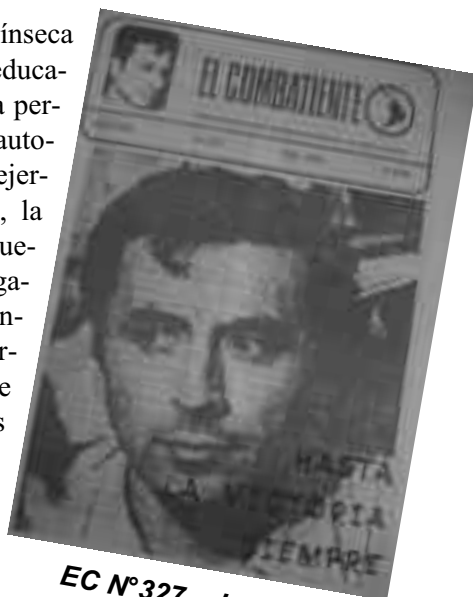
EC N°327 - Julio 1986

La unidad intrínseca de la comunidad educativa es la que va a permitir, desde la autoconvocatoria, el ejercicio en la lucha, la movilización y nuevas pautas de organización independiente que nos permitan dotarnos de nuevas, auténticas y revolucionarias herramientas que lleven a un buen puerto la lucha por nuestros reclamos.