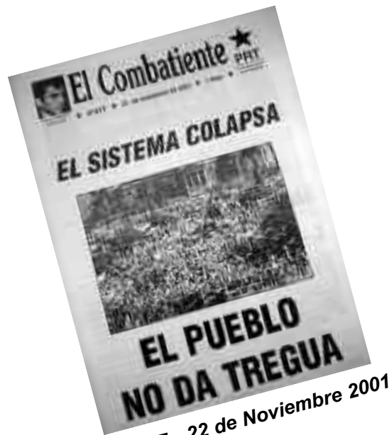
EC N°677 - 22 de Noviembre 2001

40% DE AUMENTO SALARIAL $ 5.000 DE SALARIO MÍNIMO POR 8 HORAS DE TRABAJO DEROGACIÓN DEL IMPUESTO A LAS GANANCIAS AL SALARIO BASTA DE CONTRATADOS Y TERCERIZADOS