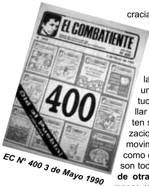
EC N° 400 3 de Mayo 1990

cracia” y sus instituciones, haciendo que cada vez más amplios sectores se lancen decididos a la búsqueda de una salida que dé solución a los problemas reales que el Estado al servicio de los monopolios, nunca nos va a dar.