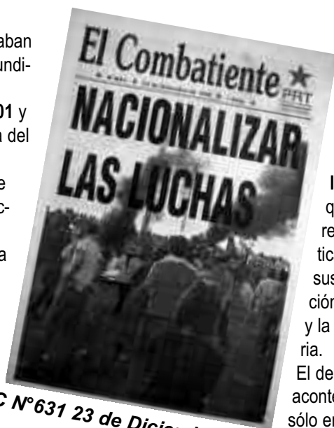
EC N°631 23 de Diciembre 1999

La propaganda sola no hace la Revolución; pero