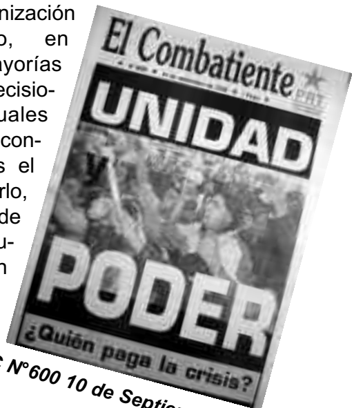
EC N° 600 10 de Septiembre 1998

esa democracia revolucionaria con la que deberán confrontar los planes burgueses. El tiempo dirá qué realidad es la que se impone. ★