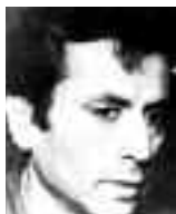
MARIO ROBERTO SANTUCHO

Tenemos que continuar exigiendo la construcción de viviendas dignas y la transparencia de su otorgamiento. Basta de extorsiones y de negociados con nuestras necesidades. Luchemos unidos por nuestra dignidad. Una vivienda por cada familia. ★