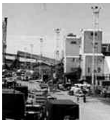
Transportistas de cereales