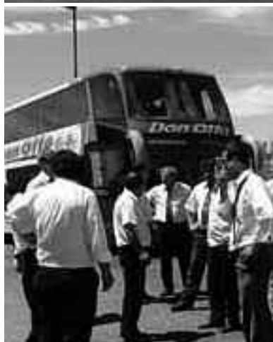
Choferes de larga distancia