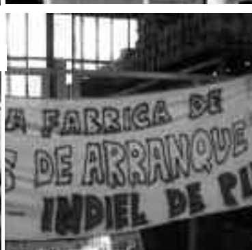
Obreros de Prestolite de pie