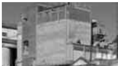
Bloqueo a la planta de Cargill