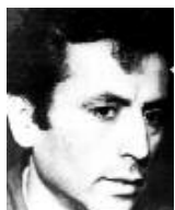
MARIO ROBERTO SANTUCHO

Este periódico ha sido editado e impreso con el aporte del pueblo trabajador