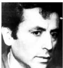
MARIO ROBERTO SANTUCHO