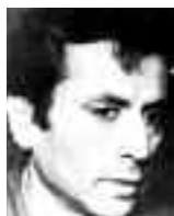
MARIO ROBERTO SANTUCHO

¡¡Basta de Ceamse, basta de Care!! PARA EL PUEBLO, NI LA VIDA, NI LA MUERTE SON UN NEGOCIO. ★