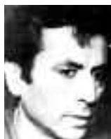
MARIO ROBERTO SANTUCHO

No obstante, no es a un pueblo ingenuo al que se le quiere imponer estas medidas: estamos hablando de la misma comunidad que sacó a fuerza de marchas y una lucha sostenida a la Ley Federal en Capital Federal y Neuquén hace 20 años; de la misma que toma cada vez más establecimientos en reclamo de sus derechos; de la misma que está cansada de no ser consultada en las decisiones; y de la misma que este año defenderá los espacios de participación eficiente y vinculante, con respaldo en su organización.★