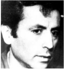
MARIO ROBERTO SANTUCHO