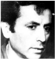
MARIO ROBERTO SANTUCHO