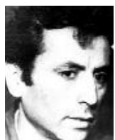
MARIO ROBERTO SANTUCHO

Este periódico ha sido editado e impreso con el aporte del pueblo trabajador