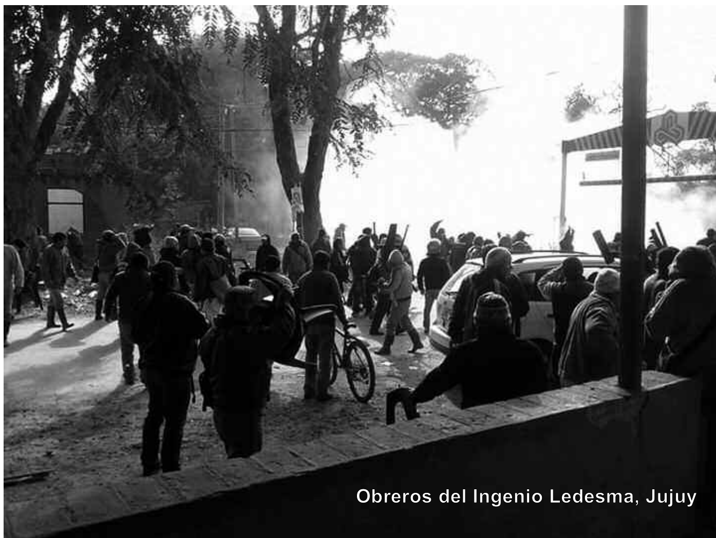
Obreros del Ingenio Ledesma, Jujuy

La memoria de la clase obrera y el pueblo nos traen hasta el presente los efectos que ocasionaron las movilizaciones correntinas estudiantiles en el contexto nacional que desembocaron en el Cordobazo, que terminó de tumbar a la dictadura de Onganía en 1969. Ahora se trata de obreros y pueblo movilizados... Los reflejos de la historia están grabados en la memoria de clase de cada obrero de la Tipoití, del Tabacal y del Ingenio Ledesma. ★