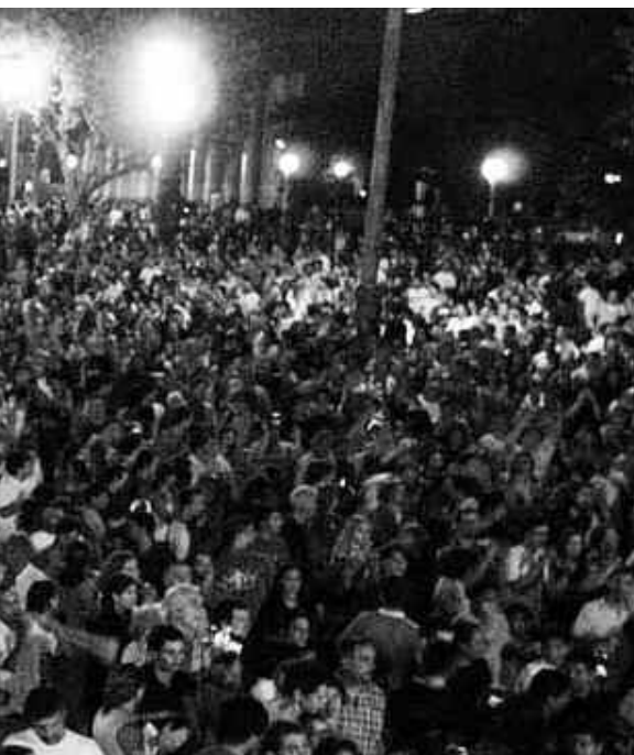
Jornadas de protestas Diciembre de 2001

En este diciembre, los revolucionarios iremos plantando bandera. Esperaremos el 2017 fortaleciendo lo que ya se ha echado a andar, consolidando los pasos dados. Lo nuevo lucha por desplegarse. No es fácil ni lo será, pero nuevo no es sinónimo de débil, aunque haya parte de verdad. Lo nuevo radica en que el cambio está en la masividad de las acciones revolucionarias y ello ha comenzado rodar. ★