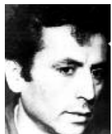
MARIO ROBERTO SANTUCHO

Este periódico ha sido editado e impreso con el aporte del pueblo trabajador