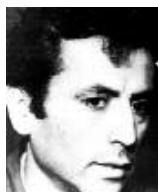
MARIO ROBERTO SANTUCHO

Este periódico ha sido editado e impreso con el aporte del pueblo trabajador