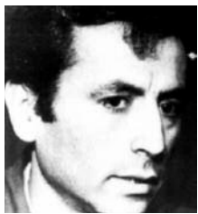
MARIO ROBERTO SANTUCHO