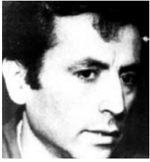
MARIO ROBERT SANTUCHO