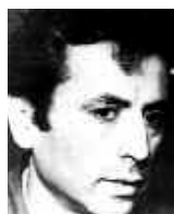
MARIO ROBERTO SANTUCHO

Este periódico ha sido editado e impreso con el aporte del pueblo trabajador