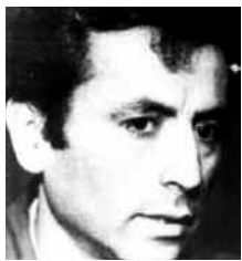
MARIO ROBERTO SANTUCHO