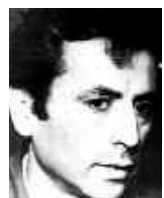
MARIO ROBERTO SANTUCHO

Este periódico ha sido editado e impreso con el aporte del pueblo trabajador