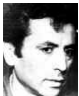
MARIO ROBERTO SANTUCHO

Este periódico ha sido editado e impreso con el aporte del pueblo trabajador