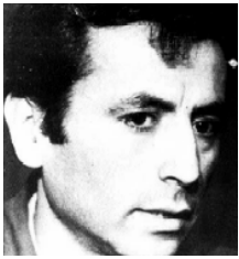
MARIO ROBERTO SANTUCHO