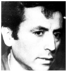
MARIO ROBERTO SANTUCHO